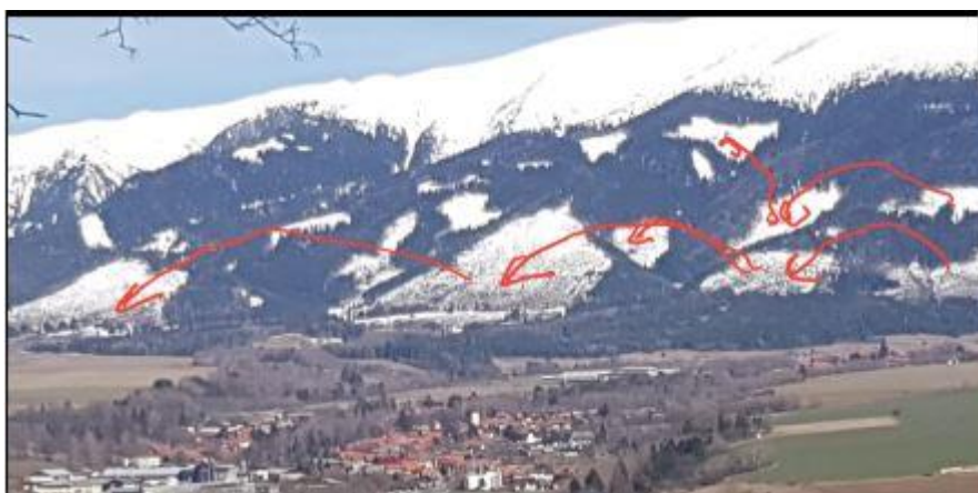
Medzigeneračný prelet lykožrúta po svahoch Západných Tatier

Parametre neurčitosti umožnili určiť výskyt podkôrneho hmyzu v polomoch, ktoré zostali nespracované po 19. tom novembri 2004 v TANAPe v celkovom objeme cca 600 000 m 3 na základe rozhodnutia Štátnej ochrany prírody. Vypočítaná gradácia lykožrúta napríklad pre polom v Tichej doline v rozsahu 65 000 m 3 ukázal, že stav kalamity v zmysle platnej legislatívy v podobe STN 48 2711:12 a/alebo 180/96 Sb., dosahuje polom už pri prvej generácii lykožrúta, ktorý je prítomný v zdravom lese ako dôsledok oslabenia bioregulačných mechanizmov lesa v polome. To indikuje, že pôvodné postupy lesníkov v podobe spracovania polomu v najkratšom možnom čase je stále riešením, ktoré vyhovuje ustanoveniu §29 písmeno d) zákona 543/2002 Z.z. t.j., správca lesa je povinný pri ohrození majetku aktívne zasiahnuť, pretože autoregulačná kapacita ekosystémov lesa boli prekročené a les neodvratne speje k rozpadu – majetok sa dostal do stavu bezprostredného ohrozenia v biologickom zmysle. Preto postup ŠOP v rokoch 2004 a ďalej ohľadom ponechania polomov v rozsahu 600 000 m 3 je možné charakterizovať v súlade so štruktúrovanými bezpečnostnými scenármi ako SABOTÁŽ.